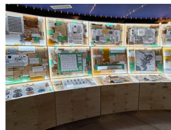
内房総アートフェス作品 『SKY EXCAVATER』